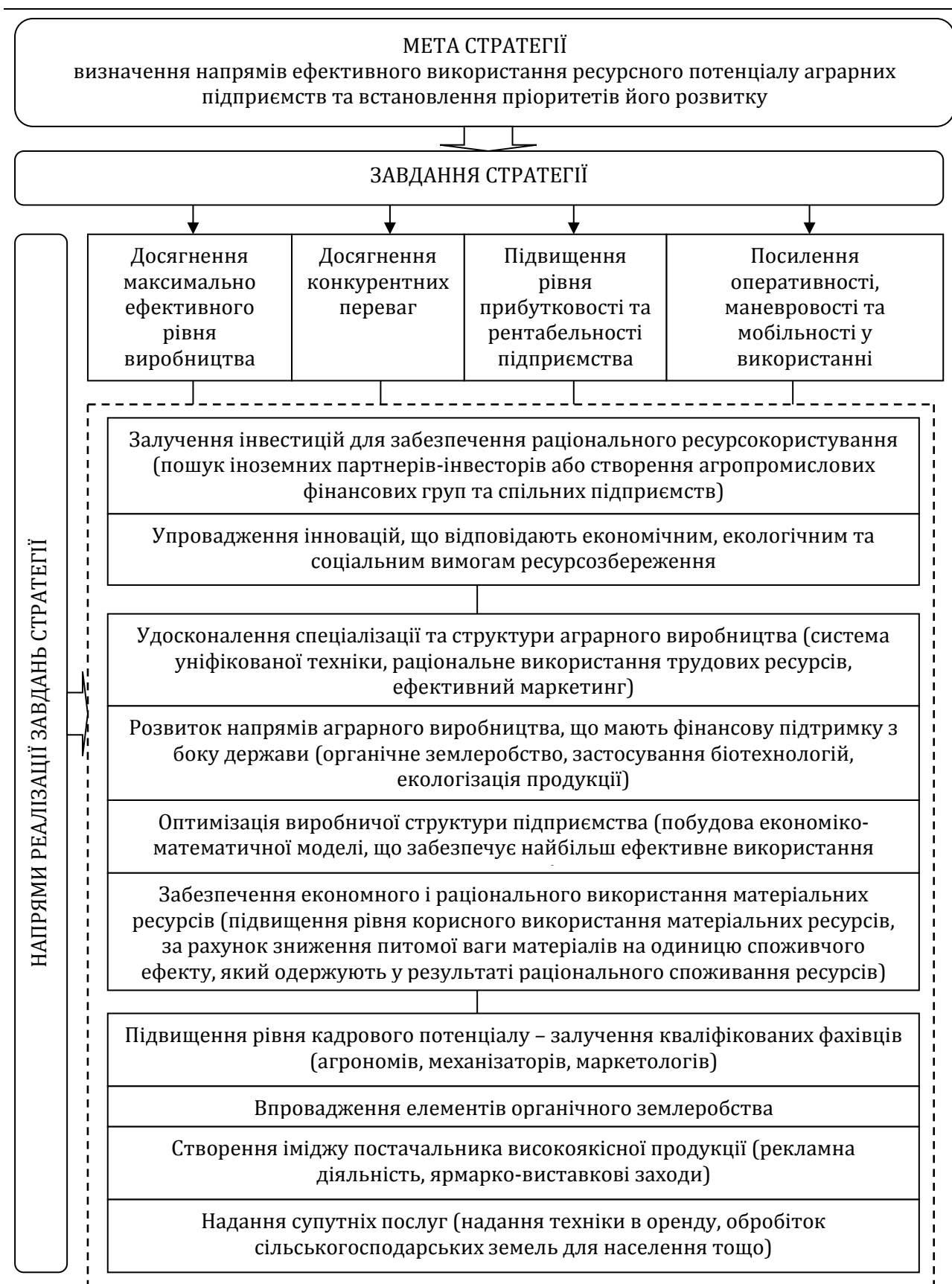
Рис. 1. Мета та завдання стратегії розвитку ресурсного потенціалу аграрних підприємств